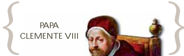
PAPA CLEMENTE VIII

prime piazze, insieme al nuovo Palazzo Comunale e alle scuole, mentre l'On. Andrea Costa inaugura il tronco ferroviario, che collegherà il territorio ai centri principali della Romagna. Nel frattempo si fa pressante quel bisogno di riscatto sociale di una popolazione che vive per i due terzi nella totale indigenza ed è vittima di un ambiente malsano. Questo riscatto delle mondine e dei braccianti che parte dai sanguinosi fatti del 1890, diventa il motore dello sviluppo economico del Novecento. Nascono le prime società di mutuo soccorso, a cui seguono le cooperative dei braccianti di Conselice e Lavezzola e il triste paesaggio economico dell'Ottocento si trasforma. Spariscono i latifondi e le risaie, si chiudono le grandi opere di bonifica e lo sforzo della popolazione permetterà di fondare un sistema economico composto da moderni impianti agricoli e da un fiorente distretto di piccole e medie imprese.